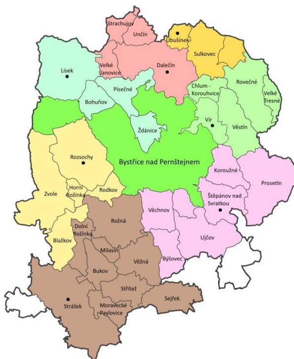
Obr. 1 Buňky Mikroregionu Bystřicko

Každá obec a tedy starosta na SO ORP Bystřice nad Pernštejnem by měla dostat stejný přístup i informacím a aktualitám. Starosta bude mít možnost rady a podpory jak v kanceláři MB, v případně nutnosti se starostou/zástupcem buňky.